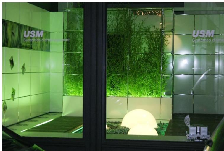
Voyage dans le jardin de Maître Rikyu - Le jardin de Thé Scénographie pour les meubles USM Designer's Days - Paris 2006