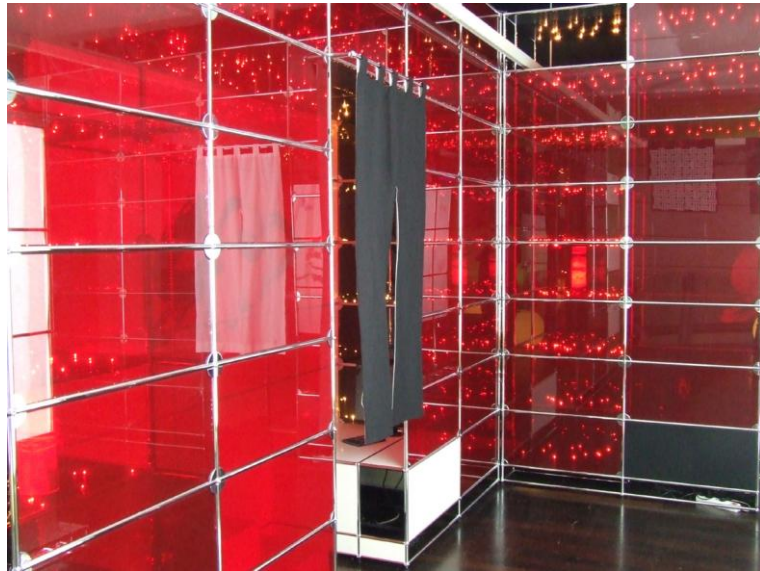
Voyage dans le jardin de Maître Rikyu - La demeure du Taïko Scénographie pour les meubles USM Designer's Days - Paris 2006